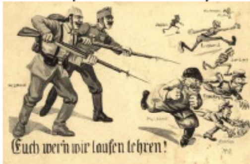
The poster from Germany