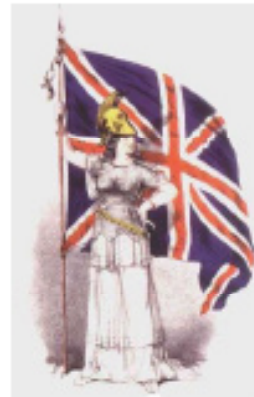
The poster from the United Kingdom