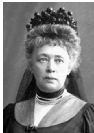
Bertha von Suttner